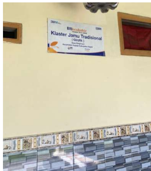
Gambar 1. Survei UMKM Bu Girofik