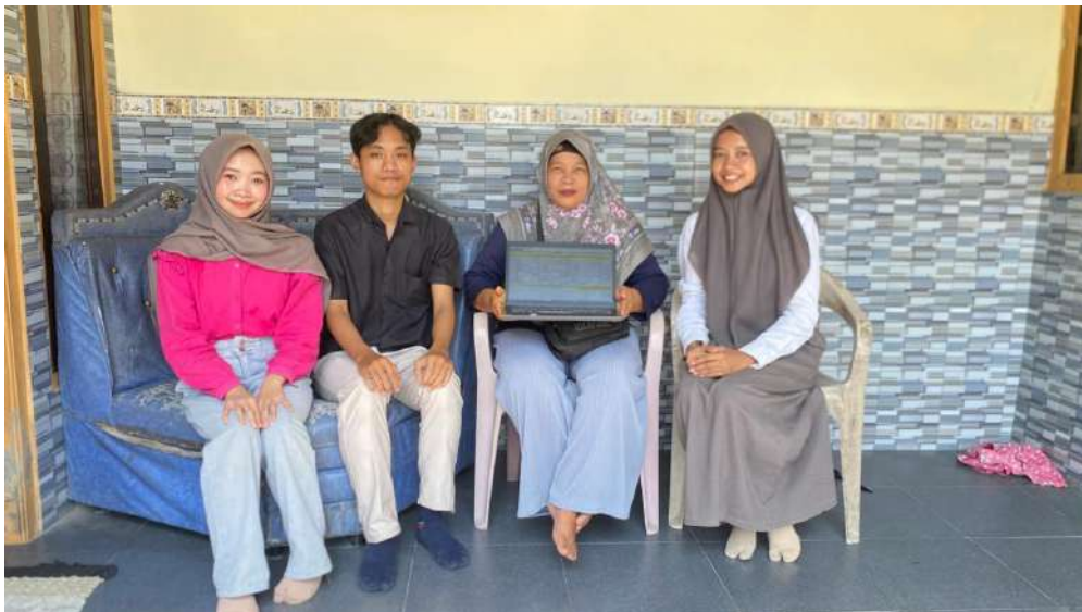
Gambar 2. Pelatihan Pembuatan Konten Video dan Penyusunan Laporan Keuangan Sederhana

Setelah dilakukan penyampain materi, pemilik UMKM diarahkan untuk membuat satu konten video dan laporan keuangan sederhana, hasilnya pemilik UMKM tersebut telah mampu membuat konten video dan laporan keuangan sederhana. Secara umum dapat disimpulkan bahwa pemilik UMKM tersebut telah memiliki keterampilan dalam membuat konten video dan peningkatan kesadaran dalam pentingnya pemasaran digital serta telah cukup mampu untuk menyusun laporan keuangan sederhana untuk usahanya.