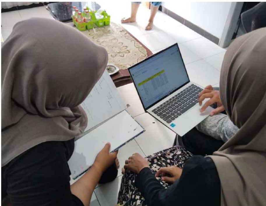
Gambar 2. Penerapan Penggunaan Spreadsheets