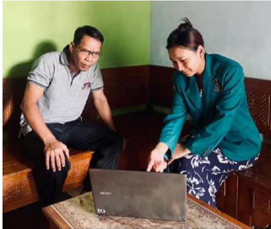
Gambar 4. Sosialisasi Sistem Pembukuan Digital kepada Pengurus RT

partisipatif, gambar berikut mendokumentasikan kerja sama antara penulis dengan Ketua RT dalam menyelaraskan kebutuhan pencatatan keuangan lingkungan dengan sistem digital yang dikembangkan.