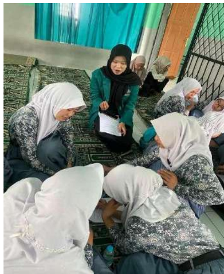
Gambar 4. Peserta mengisi evaluasi kegiatan melalui Google Form setelah workshop berlangsung.

Hasil evaluasi melalui observasi dan kuesioner Google Form menunjukkan respon positif dari peserta. Siswa menilai kegiatan ini bermanfaat, mudah dipahami, dan berbeda dari pembelajaran teori kewirausahaan yang mereka temui di kelas. Guru pendamping pun melihat peningkatan keterlibatan siswa dan menilai metode workshop lebih efektif mendorong siswa untuk berpartisipasi aktif dibandingkan metode ceramah biasa (Oktivera & Wirawan, 2020). Pembelajaran berbasis praktik menjadikan siswa lebih antusias, mampu mengembangkan ide kolaboratif, dan berani mengambil keputusan sederhana dalam konteks simulasi usaha.