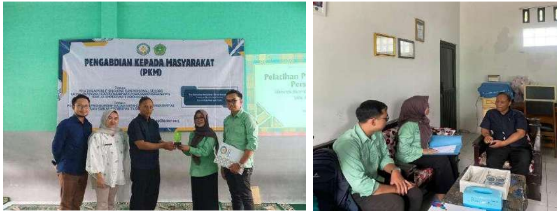
Gambar 5. Foto bersama peserta dan tim pelaksana setelah kegiatan sosialisasi dan workshop edupreneurship .