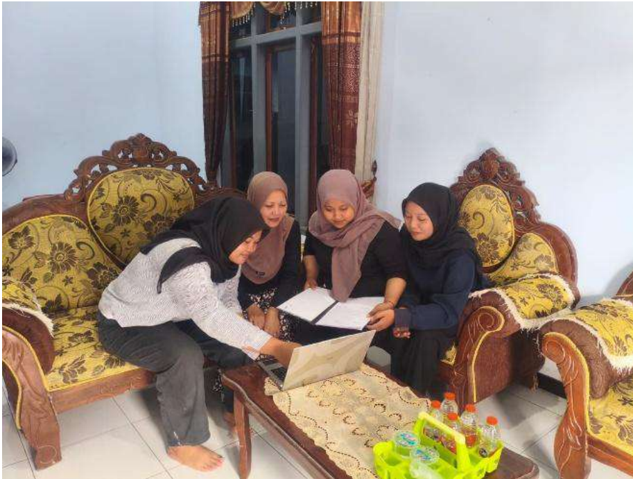
Gambar 1. Pengenalan Penggunaan Spreadsheets