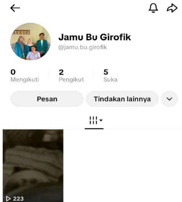
Gambar 3. Hasil dari akhir PKM UMKM Bu Girofik