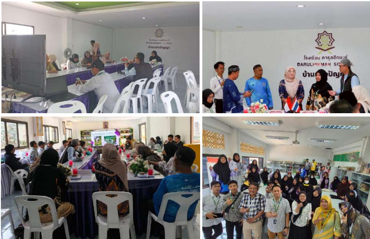
Gambar 1. Dokumentasi Kegiatan