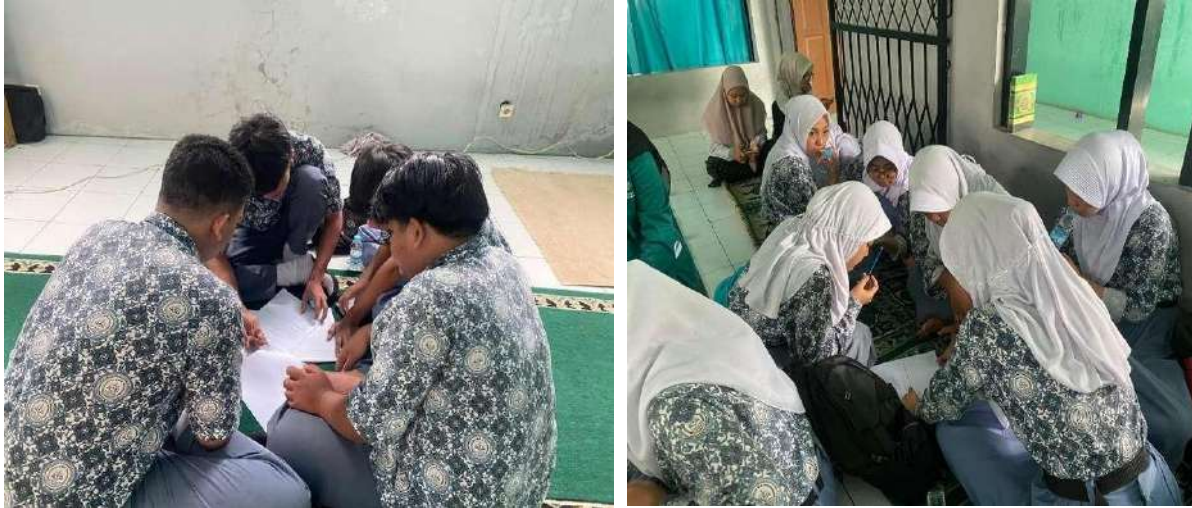
Gambar 2. Kegiatan diskusi kelompok dalam merancang ide usaha kreatif.

diberikan ruang bereksperimen, siswa mampu mengembangkan gagasan yang inovatif dan relevan dengan kebutuhan sekitar, sejalan dengan temuan Hidayat & Lestari (2021) serta Amalia & Rahmawati (2022) mengenai manfaat pendekatan edupreneurship dalam pendidikan vokasi. Kegiatan tidak hanya menghasilkan ide, tetapi juga membantu siswa memahami langkah berpikir untuk mengubah persoalan menjadi peluang usaha.