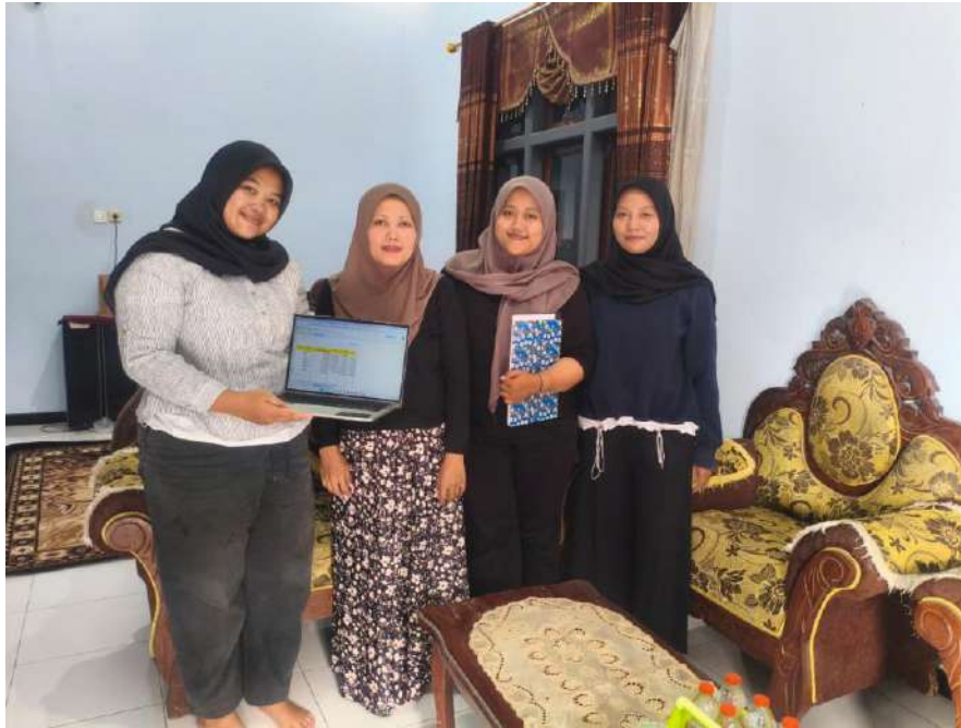
Gambar 3. Dokumentasi Bersama Bendahara PPK