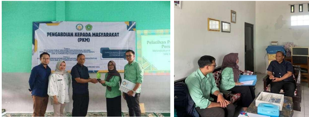
Gambar 5. Foto bersama peserta dan tim pelaksana setelah kegiatan sosialisasi dan workshop edupreneurship .