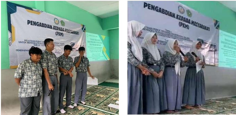
Gambar 3. Presentasi ide usaha oleh siswa sebagai bentuk penguatan komunikasi dan berpikir kritis.