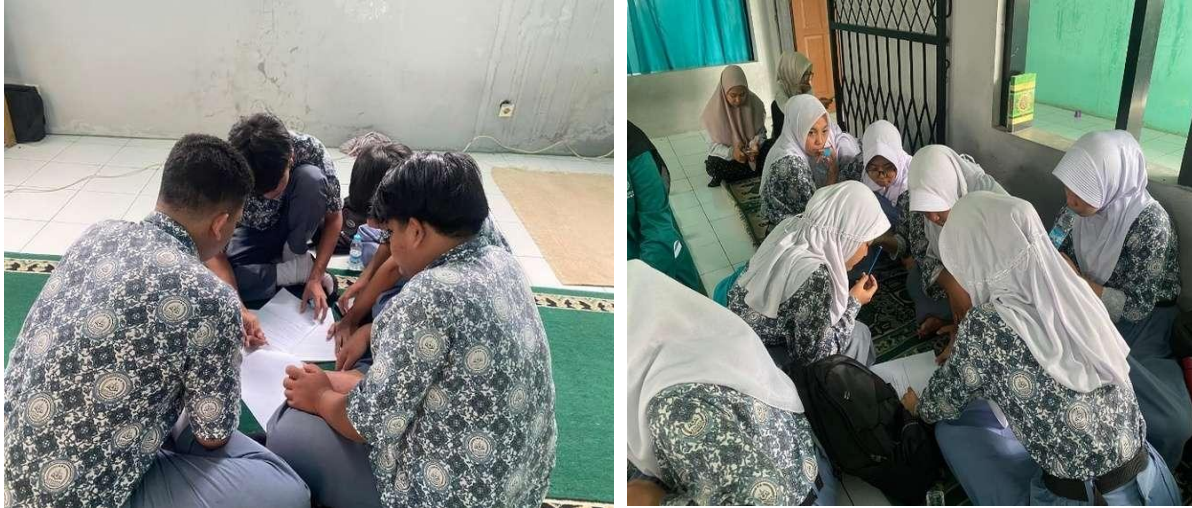
Gambar 2. Kegiatan diskusi kelompok dalam merancang ide usaha kreatif.

diberikan ruang bereksperimen, siswa mampu mengembangkan gagasan yang inovatif dan relevan dengan kebutuhan sekitar, sejalan dengan temuan Hidayat & Lestari (2021) serta Amalia & Rahmawati (2022) mengenai manfaat pendekatan edupreneurship dalam pendidikan vokasi. Kegiatan tidak hanya menghasilkan ide, tetapi juga membantu siswa memahami langkah berpikir untuk mengubah persoalan menjadi peluang usaha.