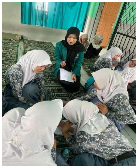
Gambar 4. Peserta mengisi evaluasi kegiatan melalui Google Form setelah workshop berlangsung.

Hasil evaluasi melalui observasi dan kuesioner Google Form menunjukkan respon positif dari peserta. Siswa menilai kegiatan ini bermanfaat, mudah dipahami, dan berbeda dari pembelajaran teori kewirausahaan yang mereka temui di kelas. Guru pendamping pun melihat peningkatan keterlibatan siswa dan menilai metode workshop lebih efektif mendorong siswa untuk berpartisipasi aktif dibandingkan metode ceramah biasa (Oktivera & Wirawan, 2020). Pembelajaran berbasis praktik menjadikan siswa lebih antusias, mampu mengembangkan ide kolaboratif, dan berani mengambil keputusan sederhana dalam konteks simulasi usaha.